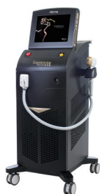
蓄熱式レーザー脱毛器 (Sopranoice PLATINUM®:Alma lasers社製)