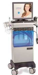
新世代ピーリングマシン (hydrafacial®:Edge Systems社製)